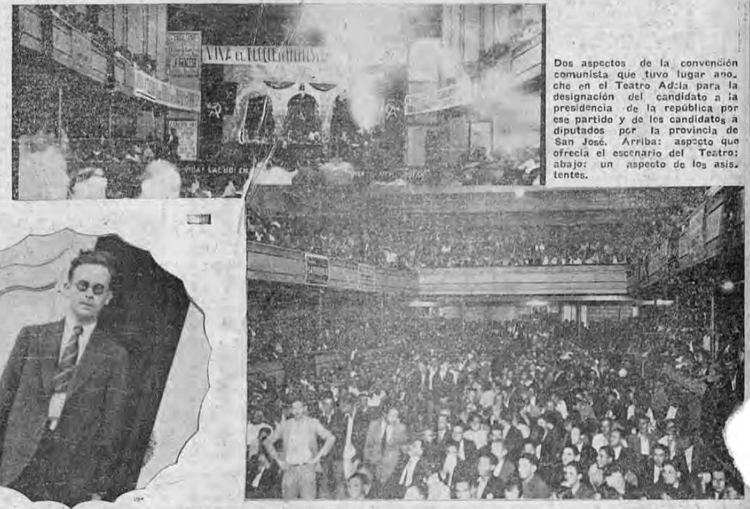
Los aspectos de la convención comunista que tuvo lugar anoche en el Teatro Adela para la designación del candidato a la presidencia de la república por ese partido y de los candidatos a diputados por la provincia de San José. Arriba: aspecto que ofreció el escenario del Teatro; abajo: un aspecto de los asistentes.